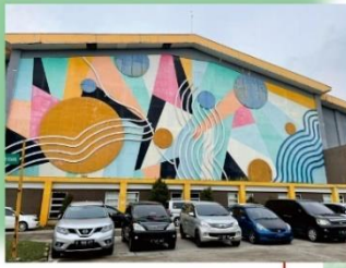
Venue SOR SABILULUNGAN