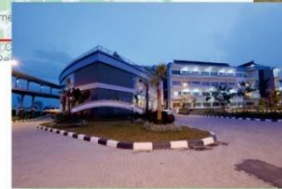
HQ Hotel : SUTAN RAJA HOTEL & CONVENTION CENTRE